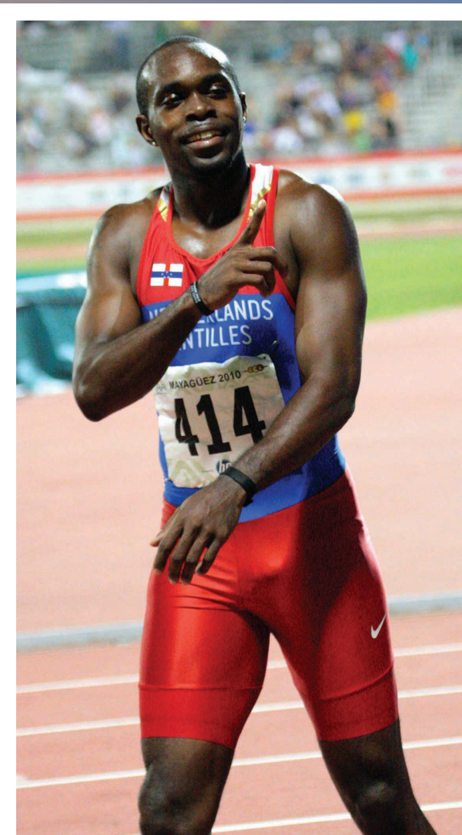
Churandy Martina de Antillas Holandesas fue doble medallista en 100 y 200 metros, con nueva marca de 20.25. Martina fue oro en los 100 metros en Cartagena '06 con 10.06.