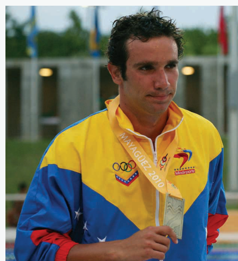
Alberto Subirats de Venezuela ganó 8 medallas en la natación, con 5 de oro, 2 de plata y 1 de bronce, repitiendo sus triunfos en los 100 metros libres. En dos participaciones en los Juegos, acumuló 16 medallas, con 11 de oro, el total más alto para cualquier nadador.

Alberto Subirats of Venezuela won 8 medals in swimming, with 5 gold, 2 silver, and 1 bronze, repeating his victories in the 100m freestyle. In two appearances in the Games he amassed 16 medals, with 11 gold medals, the highest total for any swimmer.