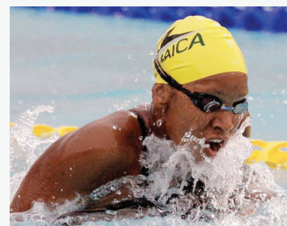
Alia Atkinson de Jamaica ganó 4 medallas de oro, tres de ellas en los eventos 50, 100 y 200 metros pecho y la otra en 200 metros combinado. En sus participaciones en los Juegos, ha ganado 8 medallas de oro y 1 de plata.

Alberto Subirats of Venezuela won 8 medals in swimming, with 5 gold, 2 silver, and 1 bronze, repeating his victories in the 100m freestyle. In two appearances in the Games he amassed 16 medals, with 11 gold medals, the highest total for any swimmer.