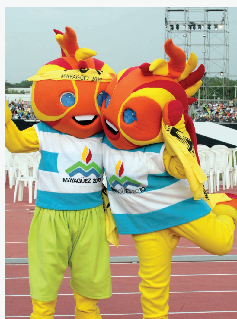
Magüe y Mayi fueron las mascotas de los Juegos.