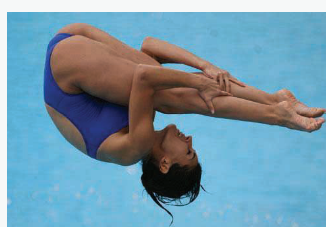
Paola Espinosa de México fue triple medallista de oro en los eventos de 1 metro, 3 metros y plataforma. En sus participaciones en los Juegos ha ganado 5 de oro, 1 de plata y 1 de bronce.

Paola Espinosa of Mexico was a triple gold medalist in the 1m, 3m, and platform diving events. In her time participating in the games she won 5 gold, 1 silver, and 1 bronze.