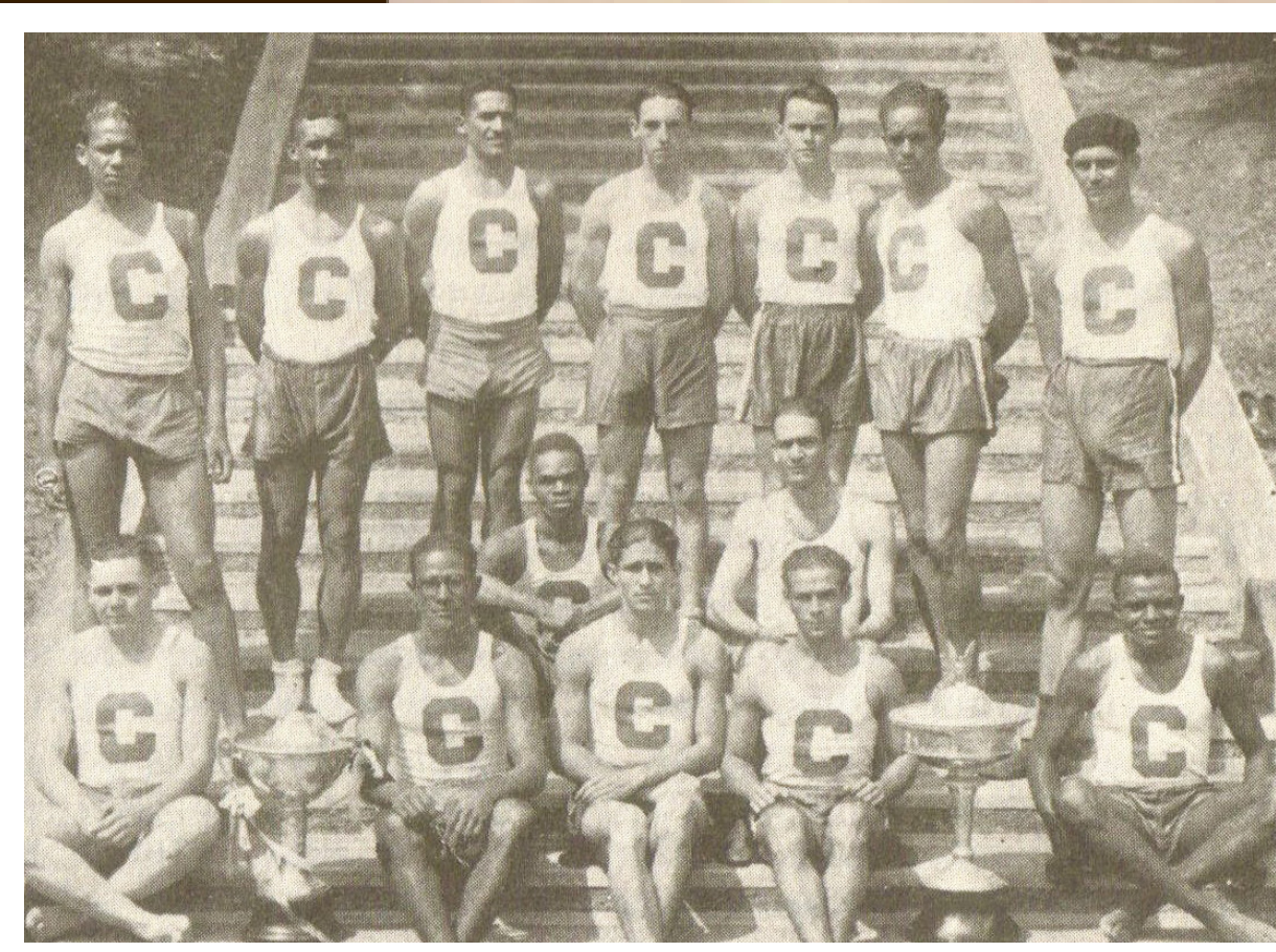
El equipo del Colegio de Mayagüez ganó las Justas de 1932, acumulando 74 puntos superando a la UPR con 50.