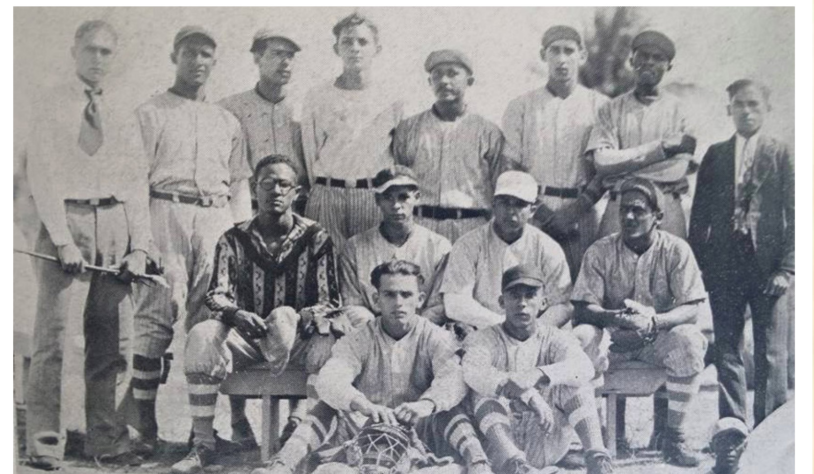
El Colegio de Mayagüez ganó seis campeonatos seguidos en el béisbol desde 1929 al 1934 y 7 de 8 que se jugaron en la década, con 9 victorias, 3 derrotas y 2 empates.

En la primera década de la Liga Atlética Intercolegial (1929-1939) se compitió en seis (6) deportes todos en hombres. El Colegio de Agricultura y Artes Mecánicas de Mayagüez (CAAM) fue la institución dominante ganando 20 campeonatos, la Universidad de Puerto Rico, recinto de Río Piedras (UPR) ganó 12 campeonatos, mientras el Politécnico de San Germán no ganó ningún campeonato. Durante la década se compitió en ocho (8) torneos de baloncesto desde el año de 1929 al 1939, con 4 campeonatos ganados para la UPR y para el CAAM, el torneo no se celebró en los años de 1933, 38 y 39. Los torneos de baloncesto contaron con los mejores jugadores del país para esa época como los hermanos Roberto y Rafita Martínez, Nono Muratti, Pepín Cestero, Manuel Carrasquillo Herpén, Víctor Mario Pérez y Rodrigo "Guigo" Otero Suro que también se destacó en el atletismo y que fue el abanderado de Puerto Rico en los IV Juegos Centroamericanos y del Caribe de Panamá en 1938.