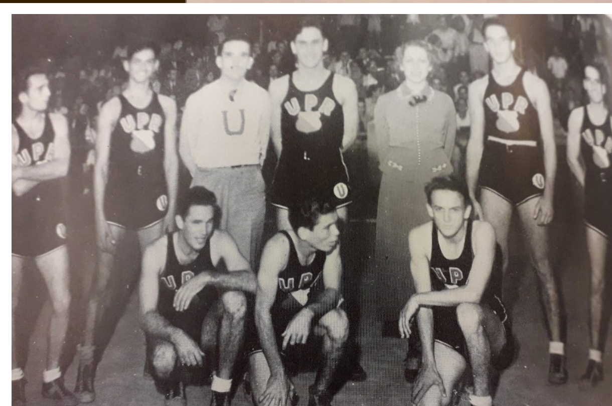
La UPR ganó el campeonato de baloncesto en 1936 deteniendo una racha de tres campeonatos seguidos del Colegio.