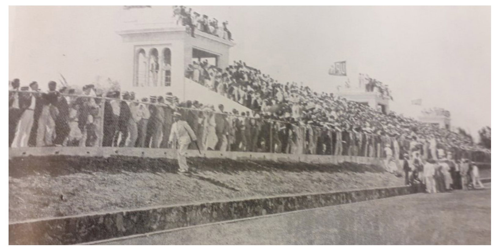
Las Justas de 1935 que se celebró en el campus de Río Piedras tuvo lleno total de público de ambas instituciones.