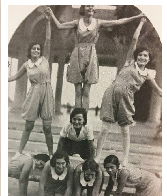
En el 1931 las estudiantes de la UPR ya practicaban el porrimo para animar a sus compañeros en las actividades deportivas.