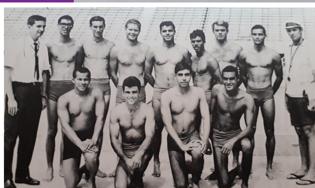
La UPR ejerció total dominio en la natación ganando 9 campeonatos seguidos en la década, en la foto el equipo de 1967 en la piscina del Escambrón.