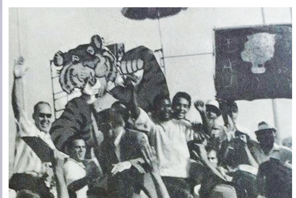
Estudiantes junto al cancellor Raymond Hoxen celebran el primer triunfo de la Universidad Interamericana en las Justas de 1965.