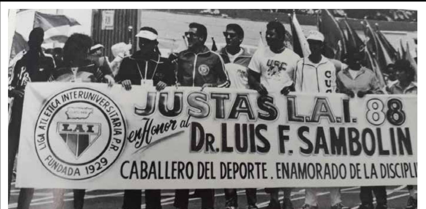
Las Justas de 1988 fue dedicada a Luis Fernando Sambolín luego de su fallecimiento en 1987. Sambolín le dedicó 45 años a la LAI en varias posiciones administrativas dentro del organismo. En esas Justas competidores de cada una de las instituciones cargaron una pancarta proclamándolo "Caballero del Deporte".